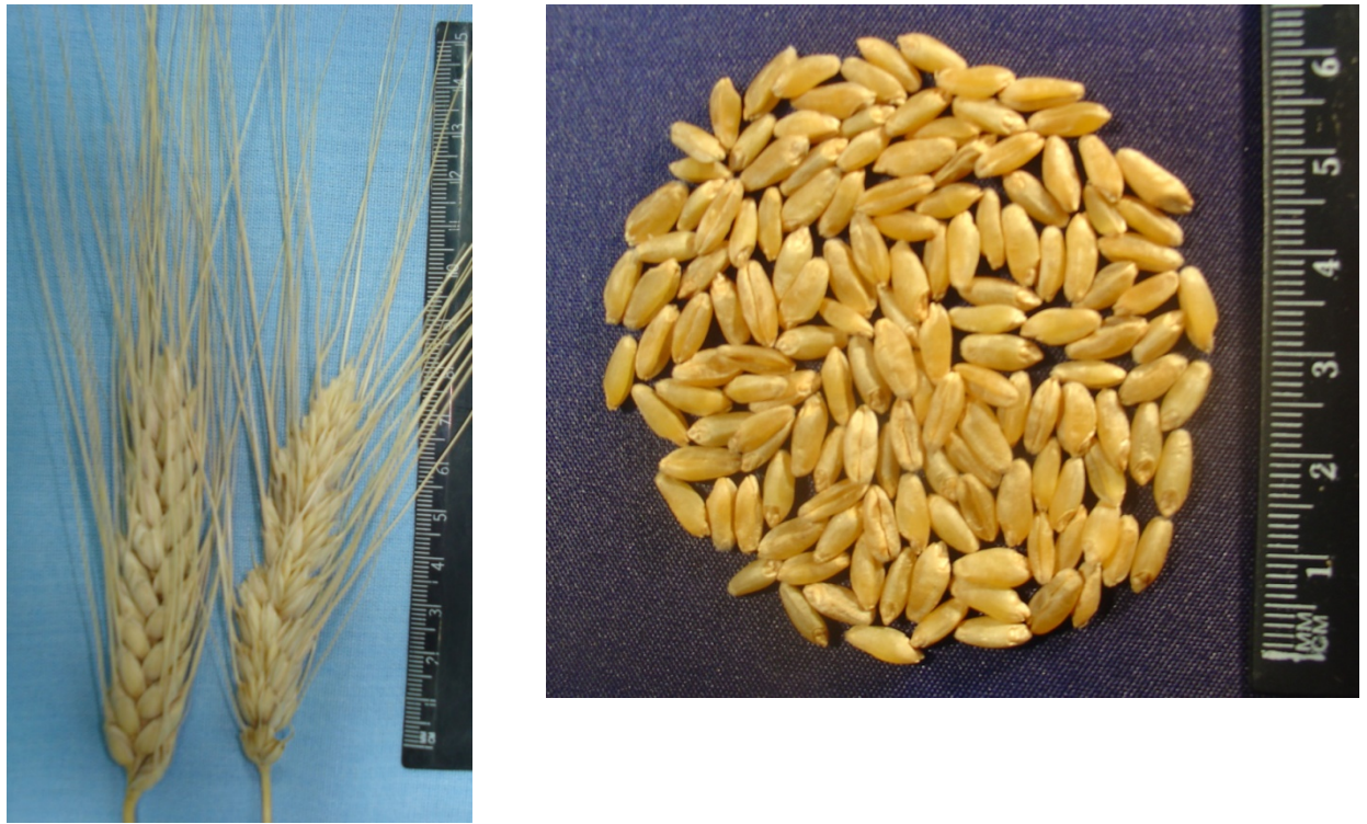
Рис. 1. Колосья и зерно сорта яровой твердой пшеницы Луч 25.

Биологические особенности. Сорт Луч 25 практически устойчив к бурой пятнистости, слабо поражается вирусными инфекциями, мучнистой росой, пыльной головней, устойчив к «черному зародышу». При создании сорта Луч 25 реализована программа по селекции сортов, устойчивых к прорастанию зерна на корню и в валках. В связи с нестабильностью погодных условий в период уборки стояла задача создать устойчивый к прорастанию традиционно белозерный сорт. В качестве источников устойчивости к предуборочному прорастанию зерна были взяты два образца пшеницы PD-44 и PD-45, которые в 1986 г. были получены от доктора R. Cantrell из университета штата Северная Дакота. Данные образцы были вовлечены в программу скрещиваний с участием лучшего селекционного материала лаборатории, адаптированного к местным условиям. Материал по степени прорастания оценивали на провокационном фоне в дождевальной камере, созданной в лаборатории [8]. В 1999 году в гибридной популяции №1117 было выявлено 57% полностью устойчивых к прорастанию колосьев. Их пересев в 2000 году послужил основой для выделения элитного растения сорта Луч 25.